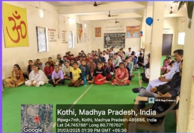
Kothi, Madhya Pradesh, India Pqwg+7mh, Kothi, Madhya Pradesh 485666, India Lat 24.745788° Long 80.776762° 31/03/2025 01:39 PM GMT +05:30