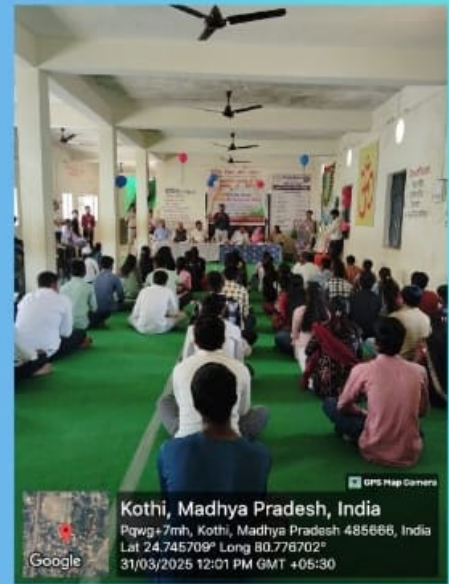
Kothi, Madhya Pradesh, India Pqwg+7mh, Kothi, Madhya Pradesh 485666, India Lat 24.745709° Long 80.776702° 31/03/2025 12:01 PM GMT +05:30