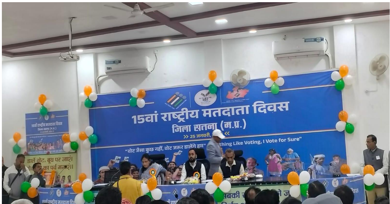
National Voters Day Celebration