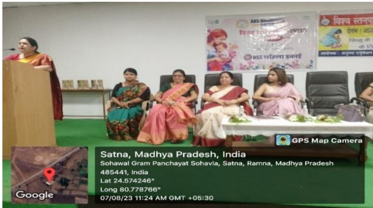
Breast Feeding Week