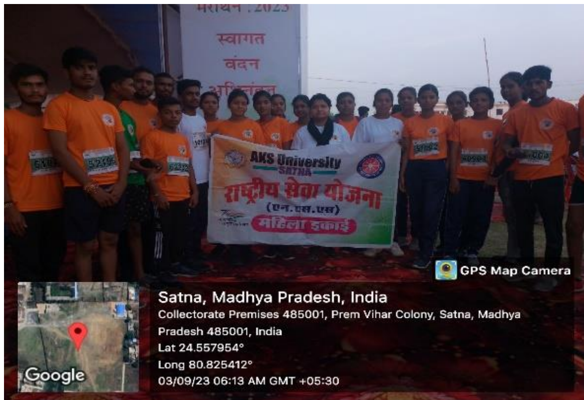
Satna Half Marathan