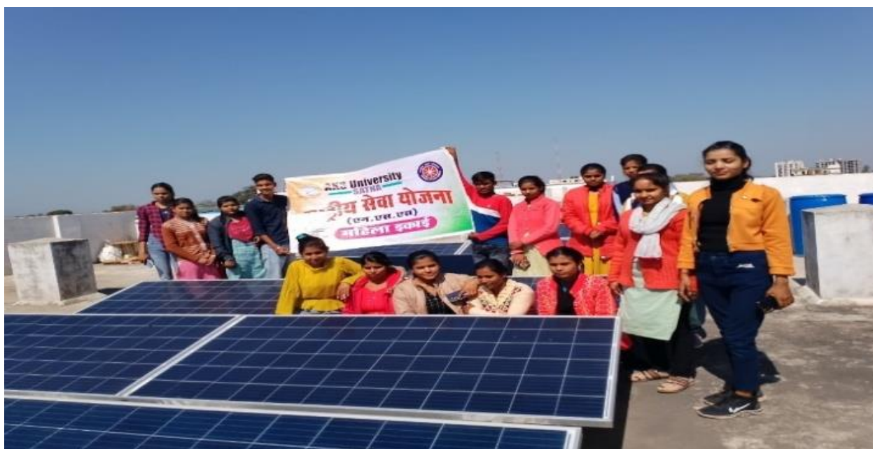
Solar Energy Awareness Campaign