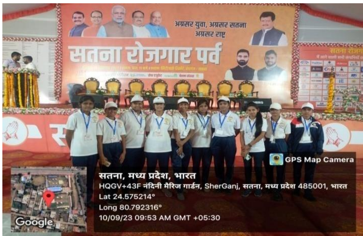
Satna Rajagar Parv