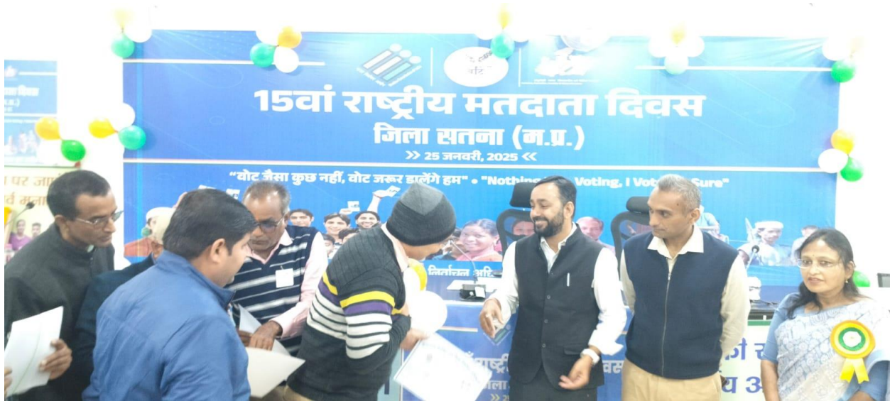
Facilitation of Campus Ambassadors during National Voters Day Celebration