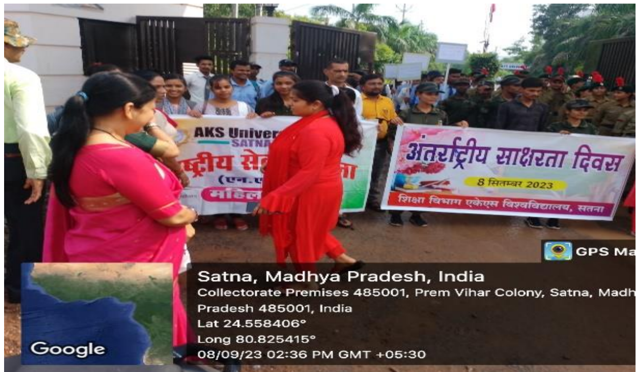
International Literacy Day Celebration