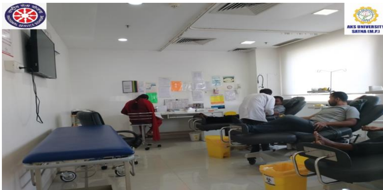
Blood Donation Camp