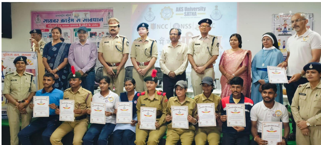
Cyber Crime Awareness Campaign