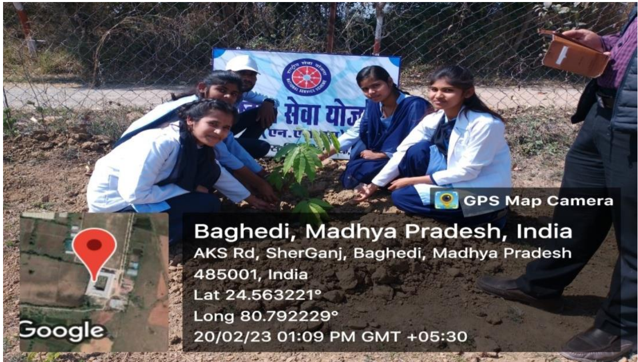
Plantation Drive and Awareness Camp